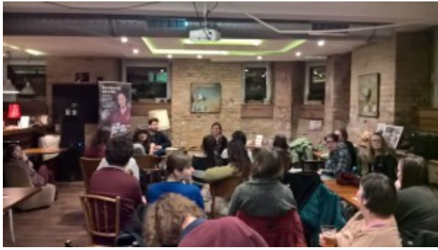
Pázmány KineDok Filmklub, 2017. december. 4.

A műhelymunkában végzett filmklubszervezésnél összetettségében és jellegében is eltér az a projekt, amelynek kezdeményezése a Hamburgi Filmfesztivál programigazgatójától, Kathrin Kohlsteddetől és a European Network for Cinema and Media Studies nemzetközi film- és médiatudományi network egyik bizottsági tagjától, Skadi Loisttól ered. Az Európai Filmakadémia (EFA) nagydíja mintájára (és azzal együttműködésben) kerül kiosztásra minden évben a „legjobb európai filmnek” szánt díj, amelyről egyetemi kurzusok hallgatói szavazással döntenek: „A kezdeményezők szándéka szerint a kezdeményezés célja, hogy a fiatalabb közönség terjessze az »európaiság eszméjét« és az európai film szellemiségét adja tovább az egyetemista közönségnek. Támogassa a filmterjesztést, filmoktatást és a vitakultúrát.” (Részlet a honlap bemutatkozó szövegéből. [27])