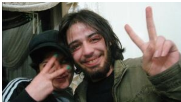
Háborús műsor (The War Show. Andreas Dalsgaard, Obaidah Zytoon, dán-szír-arab köztársasági-finn dokumentumfilm, 2017)

A projekt 2016-ban kezdődött tizenhárom egyetem részvételével, majd 2017-ben folytatódott újabb hét intézmény bevonásával (különböző országokból). 2017-ben a párizsi NECS konferencián rendezett workshopon megbeszéltük az első év tapasztalatait, megterveztük a következő évet és egy publikáció tervét, amelyben megosztjuk mindezt a szélesebb akadémiai közösséggel. Az Alphaville című folyóirat vállalta a tematikus különszám, a Teaching Dossier kiadását. [29] Itt tizenegy oktató számolt be a saját kurzusfejlesztéséről. Az összeállítás érdekessége nem csak maga az EUFA projekt különféle megvalósulásainak összevethetősége, hanem a választott módszerek, intézményes struktúrák adta lehetőségek, a diákok munkájának bemutatásán keresztül a filmoktatás (európai) sokszínűségének megismertetése. Az európai identitás összetettsége nem csak izgalmas elméleti kérdés, de akut politikai probléma is, amelynek a megértéséhez és átéléséhez a film kiváló közvetítő lehet.