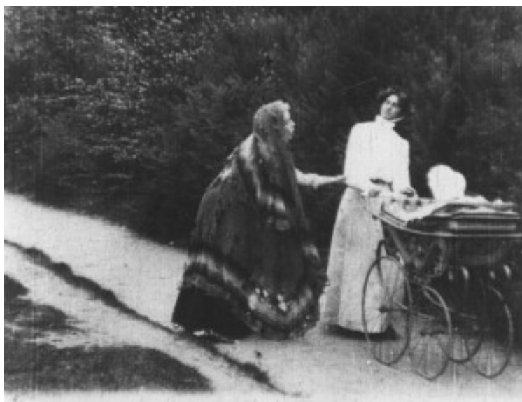
Cecil B. Hepworth és Lewis Fitzhamon: Rescued by Rover (1905)

némafilm-történet oktatásánál („A mozgóképfeltalálása és elterjedése”) állandó példám Cecil M. Hepworth és Lewis Fitzhamon Rescued by Rover (1905) című, kis költségvetéssel készült, az első kutyasztár miatt igen népszerűvé vált alkotása, amely a párhuzamos vágás mesteri alkalmazása és gyártási körülményei miatt is figyelmet érdemel. A film egy gyerekrablás történetét meséli el, amelyben a hűséges állat a fogva tartott gyermeket egy londoni nyomornegyedben találja meg. A tolvaj eredetileg egy munkásasszony volt, ám az akkori munkásszakszervezetek tiltakozásának hatására a plakátokon, a tartalomleírásokban lecserélték: a rabló szerepében ezután „egy cigányasszonyt” tüntettek fel. Érdekes fejlemény, hogy kutatásom idején a film hivatalos, a British Film Institute-ből származó tartalomleírásában „koldusasszony” szerepelt, a „cigány” jelzõt már csak elvétve használták pl. egy amerikai adatbázisban (ma már egyik oldal sem elérhető). A példán keresztül néhány mondatban össze lehet foglalni szegénység és etnicizálás napjainkra még inkább jellemző összefonódásának módozatait.