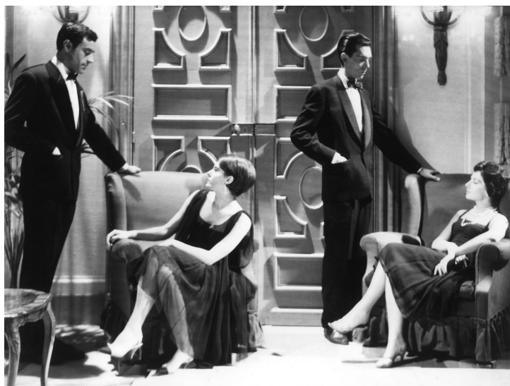
Tavalay Marienbadban (L'année dernière à Marienbad. Alain Resnais, 1961)

lehetetlenül lassú, követhetetlenül zavaros, művészileg dekadens; a dagályosság, a labirintusszerű bizonytalanság sajátos keveredése, a humor teljes hiánya anakronisztikusnak és önhittnek tűnik. A korszak nagy művészfilmjei közül talán éppen kidolgozott, arisztokratikusan formális nyelvezetének konok szigorúsága miatt vált mára a művészfilm modernista ballépéseit felvonultató, nehezen befogadható film példájává. Mindazonáltal, ha Alain Resnais nyíltabban politikai alkotásainak vagy a kortárs európai történelem faji alapon működő logikáját lemeztelenítő mai filmek (a Dardenne-fivérek, Michael Haneke) kontextusába helyezzük, a film erőltetett hangneme összecseng a gyarmati éra utáni, francia politikai elnyomás pszichés utórezgéseivel. A film formai ambivalenciái, kétértelműségei a francia nemzeti szubjektivitás erőszakos kétfelé ágazását jelzik a kolonializmus és a neokolonializmus időszakában.