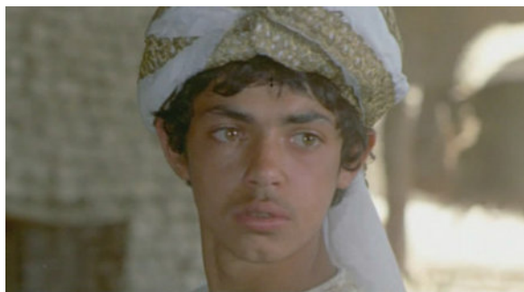
Az ezeregyéjszaka virágai (Il fiore delle mille e una notte. Pier Paolo Pasolini, 1974)

A művészfilm kategóriája többet igényel, minthogy a filmipar történetét egyszerűen csak meghintsük egy leheletnyi elmélettel. Meggyőződésünk, hogy a művészfilm kategóriája csak a filmipar, a filmtörténet és a textualitás kérdésköreit ötvöző megközelítéssel térképezhető fel. Hisszük továbbá, hogy a művészfilm sajátossága a művészet és a globális kapcsolatrendszerében érhető tetten. A kötet címe tehát nem pusztán leíró jellegű, hanem definiáló és polemizáló is egyben. A „globális” nem a művészfilm alkategóriája, hanem inherens eleme, a „művészettel” és a