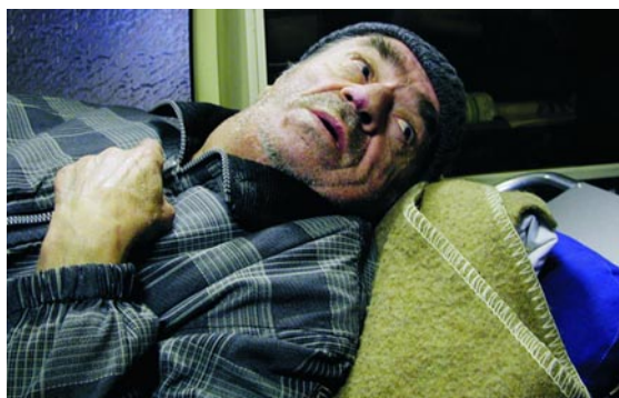
Lăzărescu úr halála (Moartea domnului Lăzărescu. Cristi Puiu, 2005)

A művészfilm kategóriája lehetővé teszi, hogy a közönség és a fesztiválok programszervezői, az ismeretlen szövegeket bevált módon asszimiláló eszközök révén, besorolják ezeket az új filmeket. Talán éppen ez az asszimiláció zavarja azokat a kutatókat, akik elvetik a kategóriát. Hiszen mindent egybevetve, ez tükrözni látszik azokat a kozmopolita kanonizációs struktúrákat, amelyeket a huszadik század végén a különbségek elfedését célzó neokolonializmussal és nyugatosítással társítottak. Ezen politikák ellenére, vagy talán ezek hatására, a filmek továbbra is a „nemzetközivé válás” útját követik. Azok a nézők pedig, akik alapvetően nem érdeklődnek a román kultúra vagy filmtörténet iránt, úgy érzik, hogy mindenképpen látniuk kell a fesztiváldíjakat besöprő, új filmeket. A várt élmény nem egy rendezőhöz, sztárhoz vagy