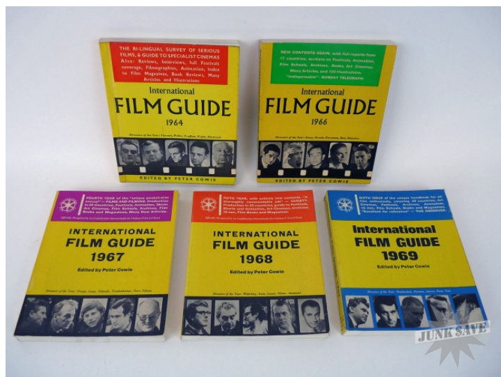
Az International Film Guide 60-as évekbeli kötetei

művészi szövegszerűség, művészmozikban történő vetítés, valamint a külföldi filmek nemzetközi forgalmazása. Ha végigkövetjük a Guide alakulását a hatvanas évektől egészen máig, nyomon követhetjük a művészfilm központi terminusként történő megjelenését. Ezenkívül azt láthatjuk, ahogyan a művészfilm földrajzilag erősen meghatározott, európai és amerikai kritikai és filmipari infrastruktúra köré szerveződő erőterré fejlődik. A Guide először Luchino Viscontit, Orson Wellest, François Truffaut-t, Andrej Wajdát és Alfred Hitchcockot válogatta be az „év rendezői” közé. Ezt követően elsősorban nyugat-európai szerzők kerültek a kanonizált listára (Federico Fellini, Louis Malle, Ingmar Bergman), amely kiegészült néhány kelet-európai (Roman Polanski, Jancsó Miklós, Dušan Makavejev), számos amerikai (John Frankenheimer, Stanley Kubrick) és egy-két ázsiai (Satyajit Ray, Akira Kurosava) névvel. A szerzőiség, valamint a nemzetitől a globális felé történő elmozdulás efféle összekapcsolása pontosan leképzi a művészfilm fejlődését az olasz neorealizmus amerikai „felfedezésétől” a nemzetközi áramlások Nyugat-Európa–Egyesült Államok-tengelye mentén kialakuló modelljéig, melybe a tengelyen kívül eső filmkultúrákból csak néhány irányadó filmrendező kerülhetett be. [3]