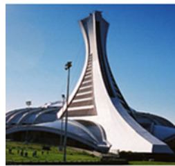
Jean Drapeau (fent), Montreal egykori főpolgármesterének karikatúrája az igen nagy költséggel épült 1976-os Olimpia Stadion látványának (lent) és a „nagy fehér elefántnak” az egybeolvasztását példázza